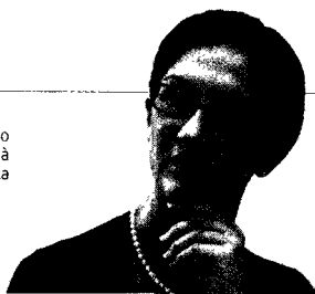
Mariastella Gelmini, ministro dell'Istruzione, dell'Università e della Ricerca

Previsti tetti massimi per la composizione dei senati accademici (l'ipotesi è di consentire al massimo 35 membri nelle università maggiori) e dei consigli di amministrazione